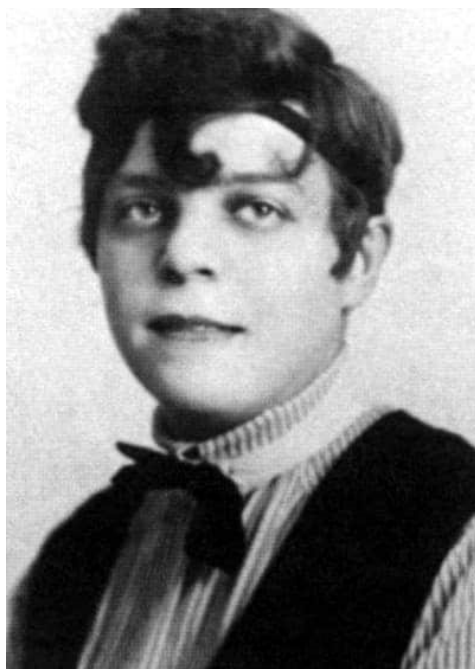
Аркадий Аверченко в юности