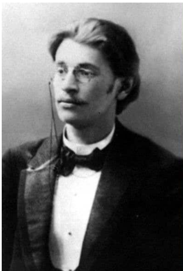
Аркадий Аверченко в молодости

Аркадий часто называл себя бездельником и лоботрясом, но это не соответствует действительности, ведь свою трудовую биографию молодой человек начал еще в пятнадцатилетнем возрасте. Вначале его взяли на должность писаря в компанию, перевозившую различные грузы, спустя год он отправился на Донбасс, работал в конторе угольной шахты примерно четыре года.