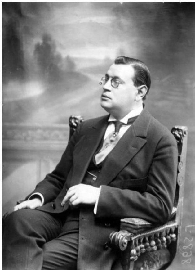
Писатель Аркадий Аверченко