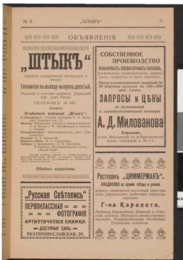
Страница из журнала «Штык» Аркадия Аверченко

Дебют будущего «короля смеха» состоялся в харьковском издании «Южный край». В 1903-м году он напечатал свой первый рассказ под названием «Как мне пришлось застраховать жизнь». Вскоре вышло еще несколько его рассказов, а потом Аверченко начал сам выпускать журнал «Штык». Он выполнял одновременно обязанности автора, иллюстратора и редактора этого издания. Аркадий сам писал юмористические рассказы, сам рисовал к ним карикатуры и шаржи, становился все более популярным у читателей. Через некоторое время молодой человек взялся за выпуск другого издания - журнала «Меч», но вскоре его закрыли.